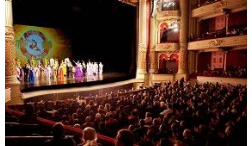
神韵巡回艺术团在费城音乐学院剧场的演出圆满落幕

一月二日晚，美国自由精神的发源地——费城的各界观众在翘首期盼中迎来了神韵巡回艺术团二零一零年全球首演。逾千名观众齐聚费城音乐学院剧场，屏息欣赏神韵，凝神体悟晚会震撼人心的精深内涵。演出结束后，观众起立长时间鼓掌致意，神韵艺术家数度谢幕答礼。