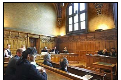
西班牙国家法院