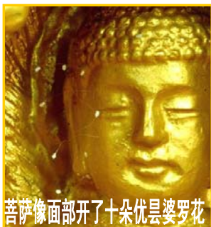
菩萨像面开了十朵优昙婆罗花

优昙婆罗花降临人间意味着什么呢？佛经记载：三千年开花一次的婆罗花的出现，意味着转轮圣王已下世在人间正法。如《慧琳音义》卷八载明：“优昙婆罗花为祥瑞灵异之所感，乃天花，为世间所无，若如来下生、金轮王出现世间，以大福德力故，感得此花出现。”