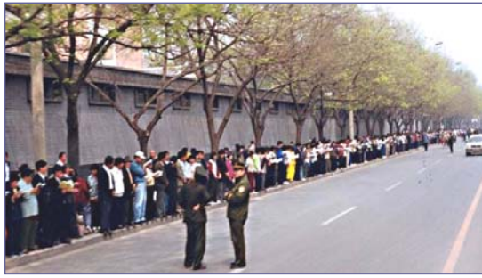
■ “4·25”现场，法轮功学员文明安静，警察不用维持秩序在一旁聊天。

信访办。当日，在国务院总理的直接关注下，合理解决了天津暴力抓人事件。晚上学员们散去时，地上一片纸屑都没有，连警察扔的烟头都给捡起来了。法轮功学员所表现出的和平理性和对正信与公义的坚守，得到了国际社会的高度评价，“4·25”上访被称作“中国上访史上规模最大、最理性平和、最圆满的上访”。