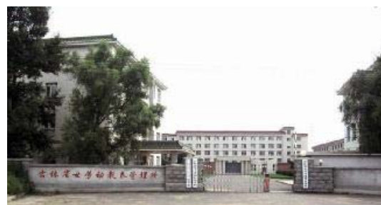
臭名昭著的吉林省长春黑嘴子女子劳教所

的迫害工具，踏着法轮功学员的鲜血，获取中共的“奖赏”，劳教所建大楼，增大队，添人马，使一个行将破产的劳教所在“起死回生”中苟延残喘。