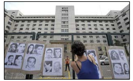
■位于首都布宜诺斯艾利斯的阿根廷法院