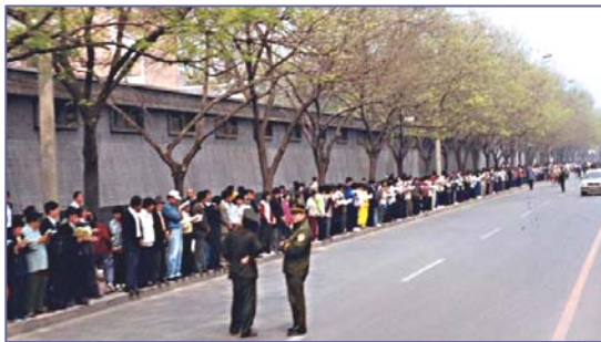
■ “4·25”现场，法轮功学员文明安静，警察不用维持秩序在一旁聊天。

信访办。当日，在国务院总理的直接关注下，合理解决了天津暴力抓人事件。晚上学员们散去时，地上一片纸屑都没有，连警察扔的烟头都给捡起来了。法轮功学员所表现出的和平理性和对正信与公义的坚守，得到了国际社会的高度评价，“4·25”上访被称作“中国上访史上规模最大、最理性平和、最圆满的上访”。