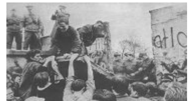
1989年11月，柏林墙推倒瞬间

【明慧网】这个故事发生在柏林墙倒塌之后的德国。1992 年 2 月，统一后的柏林法庭上，举世瞩目的柏林围墙守卫案将要开庭宣判。这次接受审判的是 4 个年轻人，30 岁都不到，他们曾经是柏林墙的东德守