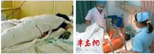
图 1：用绷带包裹严密的“自焚者”。

对比用绷带包裹严密的“自焚者”和上图中没有任何隔菌措施的采访记者，这些说明了什么？