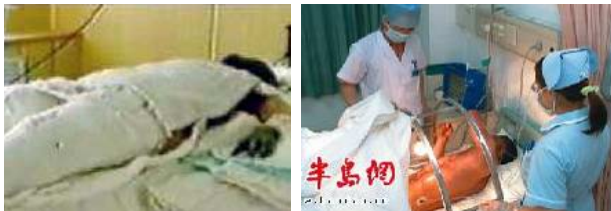
图 1：用绷带包裹严密的“自焚者”。

对比用绷带包裹严密的“自焚者”和上图中没有任何隔菌措施的采访记者，这些说明了什么？