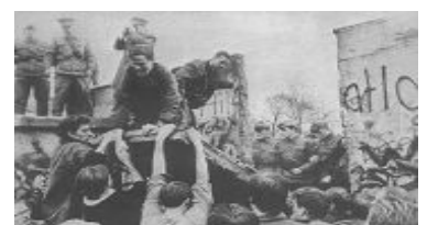
1989年11月，柏林墙推倒瞬间

【明慧网】这个故事发生在柏林墙倒塌之后的德国。1992 年 2 月，统一后的柏林法庭上，举世瞩目的柏林围墙守卫案将要开庭宣判。这次接受审判的是 4 个年轻人，30 岁都不到，他们曾经是柏林墙的东德守