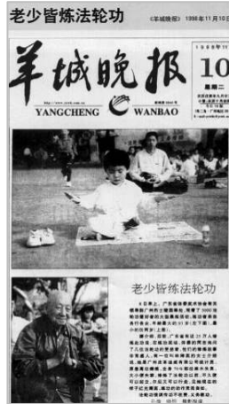
上图/1999年3月迫害前武汉法轮功学员排字炼功。 下图/1994年7月李洪志先生在大连的第二期法轮功传授班。 右图/1998年11月10日《羊城晚报》头版报道——“老少皆炼法轮功”。

轮功修炼者 12553 人，疾病痊愈和基本康复率为 77.5%，加上好转者人数 20.4%，祛病健身有效率高达 97.9%。平均每人每年节约医药费 1700 多元，每年共节约医药费 2100 多万元。