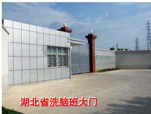
湖北省洗脑班大门

今年六月的一天，妻子打电话告诉我，原单位让我回去开会。在这之前，我已经知道点消息，说单位要破产重组。我估计单位可能要找我上班，于是就找到我现在工作单位的总经理说了我要离开的情况。总经理一