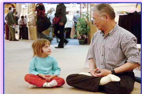
图：善良无罪，修炼高尚。