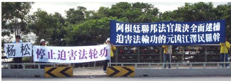
台湾法轮功学员在太鲁阁国家公园牌楼前，高举反迫害横幅。