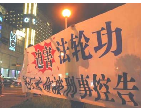
台湾法轮功学员在赵正永落脚的嘉义市耐斯饭店外面拉起横幅：“迫害法轮功 赵正永你被刑事控告了”。