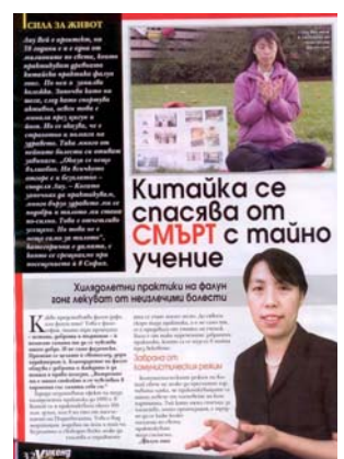
图:《女士周末》发表专访法轮功学员的文章

党员的人数。法轮功没有人员名单, 所以很难统计世界上共有多少人修炼。“法轮功既不是宗教, 也不是政治。”刘