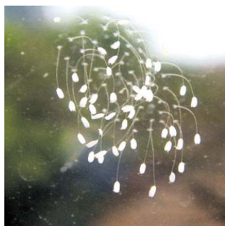
■ 2008 年青岛早报报道的 开在玻璃上的优昙婆罗花