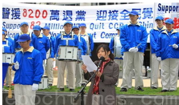
■ 2010年10月17日下午，墨尔本举行“声援8200万勇士退出中共”集会

数。因为在那个血旗面前向天发毒誓时，您是说把一生、把生命都献给邪党了。所以只有采取公开的方式退出，有行为的表示，才能除掉这么大的毒誓，才能在天灭中共的时候保平安！