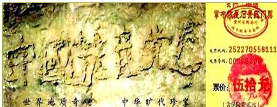
■ 上图为“藏字石”风景区门票