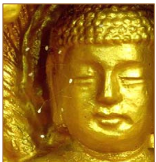
■ 2005 年韩国全罗南道须弥山禅院佛像脸上长出优昙婆罗花。