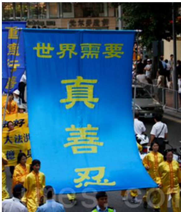
■ 2010年10月1日香港各界声援8000万勇士退出中共党团组织

参考玛雅预言，不难理解“真善忍”的弘传很可能就是预言所指的“净化”。而人们对于“真善忍”的态度也许就是能否走入未来的关键。