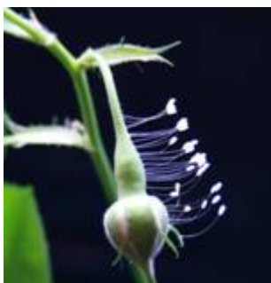
■ 从 2007 年至今，优昙婆罗花连续四年在东营、胜利油田盛开。