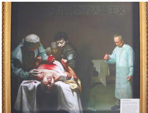
“真善忍”国际美展中展出的作品

联合国宗教或信仰自由特派专员贾汉吉尔于 2006 年 8 月 11 日就活摘法轮功学员器官的指控向中共发出联合质询，并于 2007 年 1 月 25 日再次质询。2008 年贾汉吉尔女士在报告中指出：“据报导，器官移植的数量远大于已知来源的数量。而且报导中的短暂等待时间及广告中的器官完美配型说明存在着器官移植的计算机配型系统及大型的活体来源库。……特派专员也注意到从 2000 年到 2005 年有 6 万个器官移植手术，及 6 年间每年大约 1 万个。这与对法轮功的迫害时间上相符。在 2005 年，据报导，只有 0.5% 的器官移植来自亲