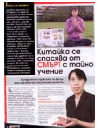
图：《女士周末》发表专访法轮功学员的文章

党员的人数。法轮功没有人员名单，所以很难统计世界上共有多少人修炼。“法轮功既不是宗教，也不是政治。”刘