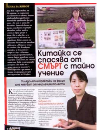
图：《女士周末》发表专访法轮功学员的文章

党员的人数。法轮功没有人员名单，所以很难统计世界上共有多少人修炼。“法轮功既不是宗教，也不是政治。”刘