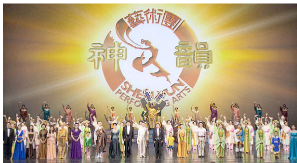
图: 神韵艺术团 (资料)