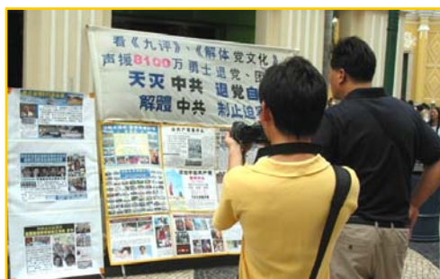
图为大陆游客正在录下真相图片。

提示: 由于恐惧,中共对退党热线做了手脚,电话接通后录音告之:这是个空号,请不要挂电话,电话很快就能接通,请相互转告。