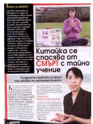
图:《女士周末》发表专访法轮功学员的文章

党员的人数。法轮功没有人员名单, 所以很难统计世界上共有多少人修炼。“法轮功既不是宗教, 也不是政治。”刘