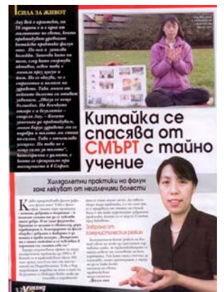
图:《女士周末》发表专访法轮功学员的文章

党员的人数。法轮功没有人员名单, 所以很难统计世界上共有多少人修炼。“法轮功既不是宗教, 也不是政治。”刘