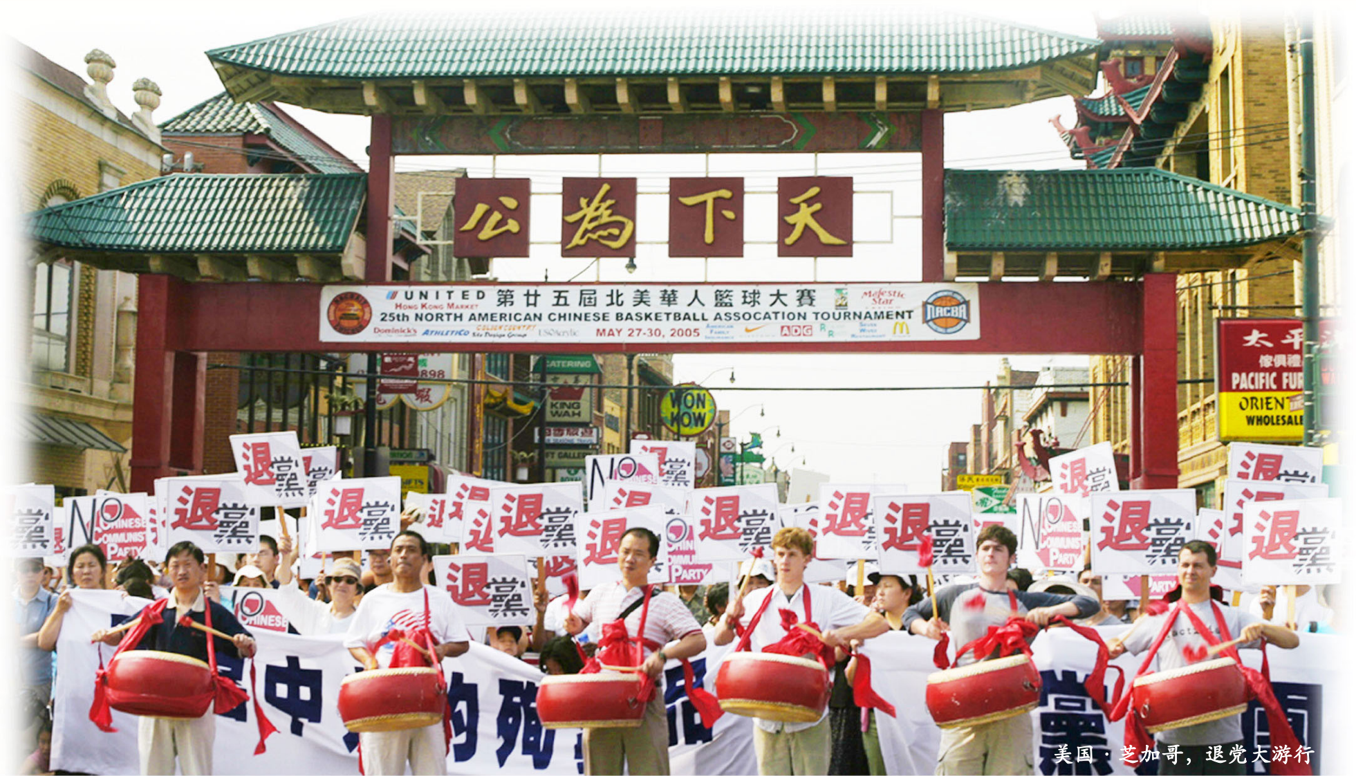
美国·芝加哥，退党大游行