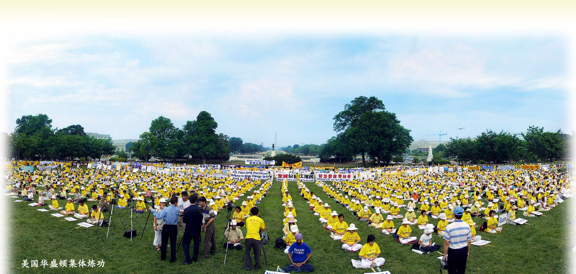
美国华盛顿集体炼功