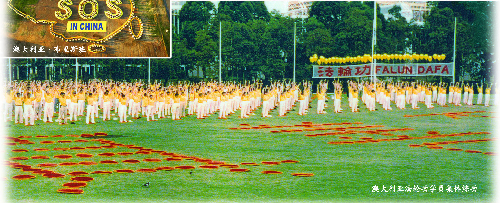
澳大利亚法轮功学员集体炼功