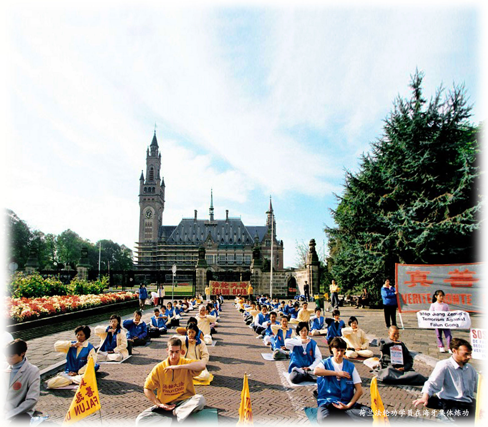
荷兰法轮功学员在海牙集体炼功

在欧洲各国巡览，您都能见到法轮功学员炼功、传播真相的身影。他们以各种方式向人们讲述着真相：节日游行，真相图板，文艺演出，美术巡展……其中天国乐团的游行表演，已经成了欧洲街头绚丽的风景线。