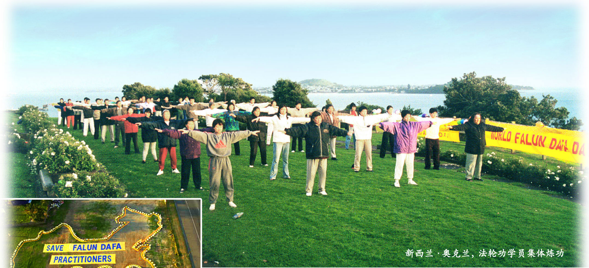
新西兰·奥克兰，法轮功学员集体炼功