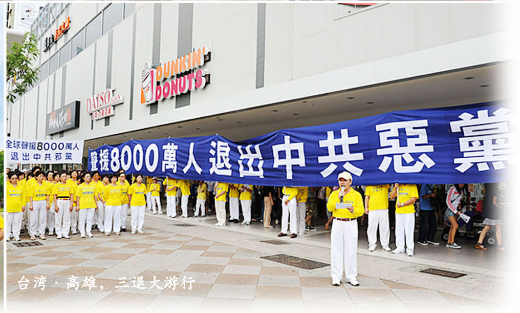
台灣·高雄，三退大游行