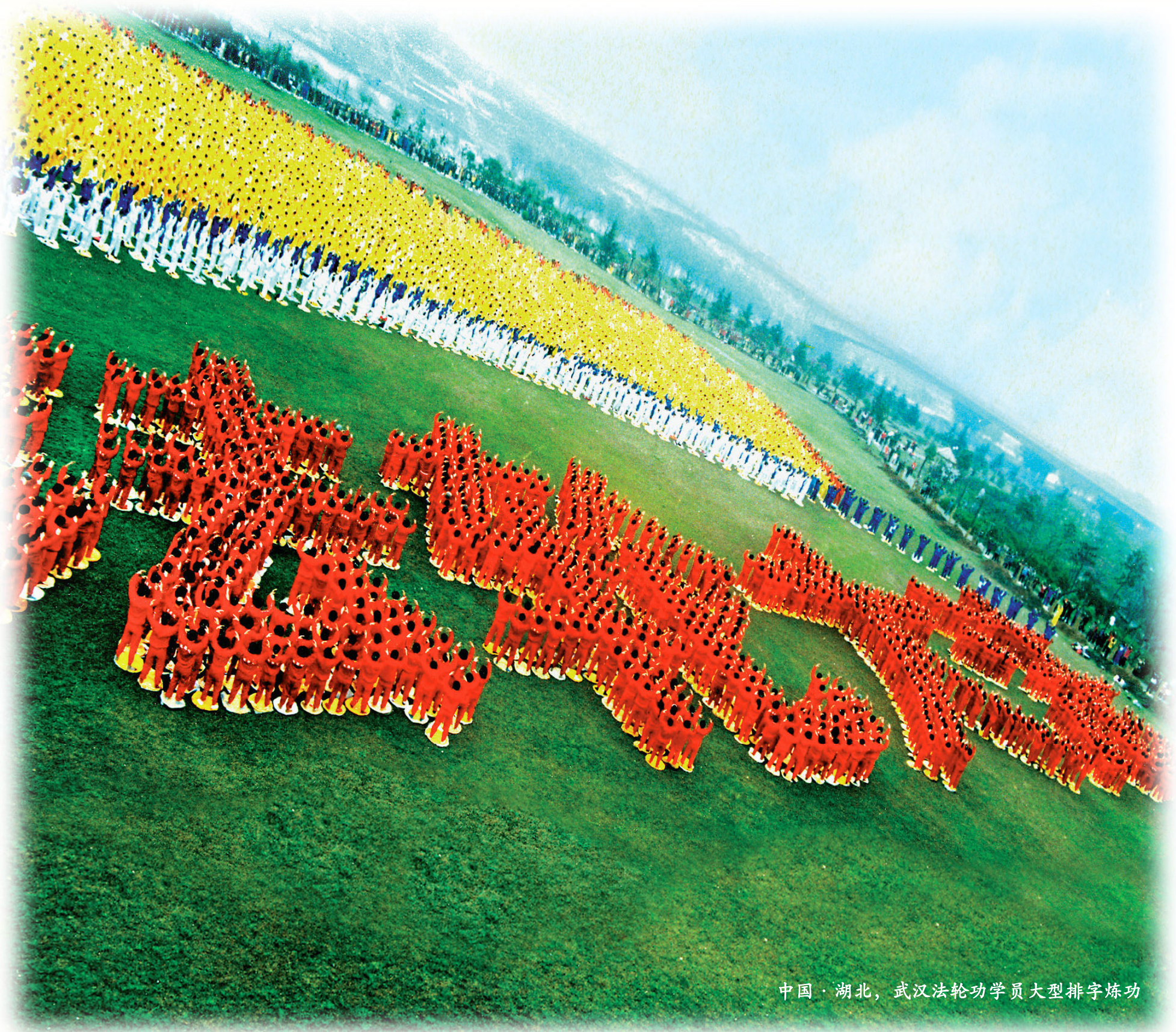
中国·湖北，武汉法轮功学员大型排字炼功

有些人说：“法轮功 4·25 不围攻中南海，政府能迫害吗？”其实中共蓄谋已久，没有 4·25 也要造出别的借口迫害。踏着 1989 年“六四”鲜血上台的江泽民，由于缺乏政绩和才能，急于树立其“核心”权威，为一己和一党之私反对“真、善、忍”，是这场罪恶能够发生的真正原因。