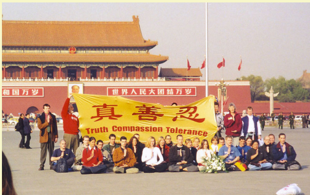
■ 2001 年，12 个国家的 36 名西方人在天安门请愿

在南美洲，法轮功弘传 15 国。早在 2002 年前后，秘鲁、阿根廷、委内瑞拉等国已相继成立了法轮大法学会，西班牙文《转法轮》成为阿根廷最受欢迎及销量最大的图书之一。在秘鲁，国家廉正公署最高长官签授法轮功学员表彰证书，反腐败机构的总部组织百名警察学炼法轮功。在玻利维亚，总统在了解法轮功真相后，亲自表达对诉江案的支持。