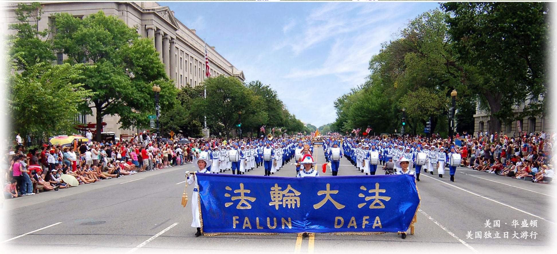
美国·华盛顿 美国独立日大游行

中共迫害法轮功已长达十一年。每年的7月，都会有数以千计的法轮功学员汇集在美国首都华盛顿的国会山，呼吁更多人认清中共的邪恶，制止其对法轮功学员的残酷迫害。