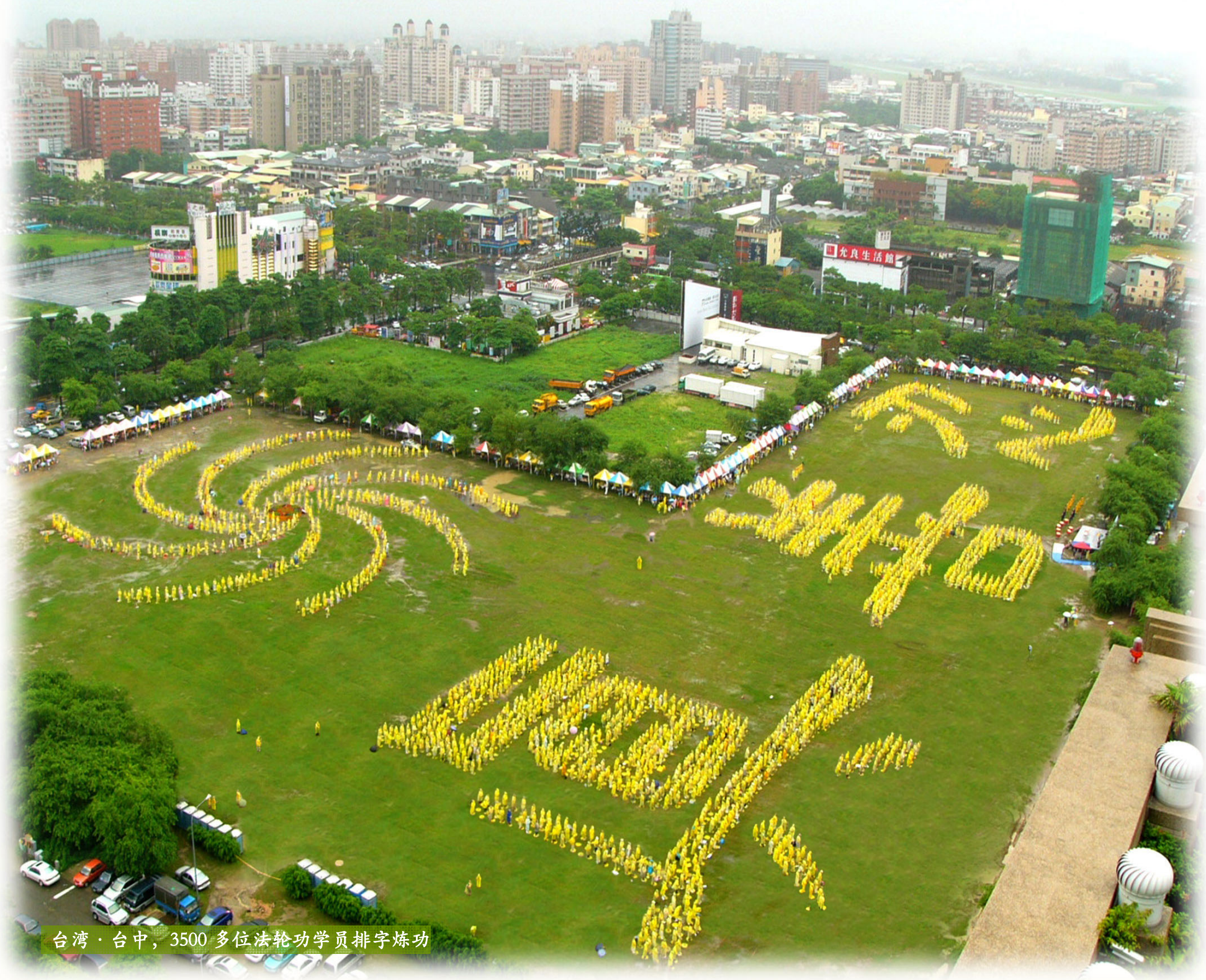
台湾·台中，3500 多位法轮功学员排字炼功