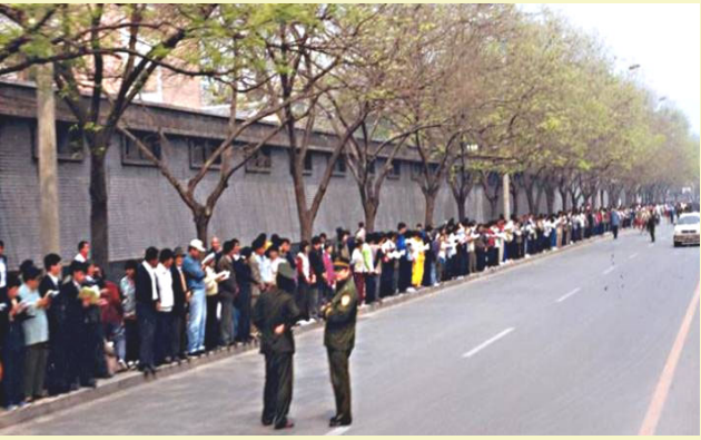
■ 4·25 和平上访，被歪曲为“围攻中南海”

而在 4·25 当晚，妒忌成性的江泽民把和平上访歪曲成“围攻中南海”。江不顾其他六个常委的反对，一意孤行，令罗干紧锣密鼓，于同年 7 月开始全面迫害法轮功。