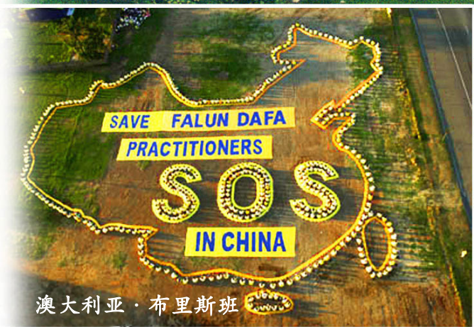
澳大利亚·布里斯班