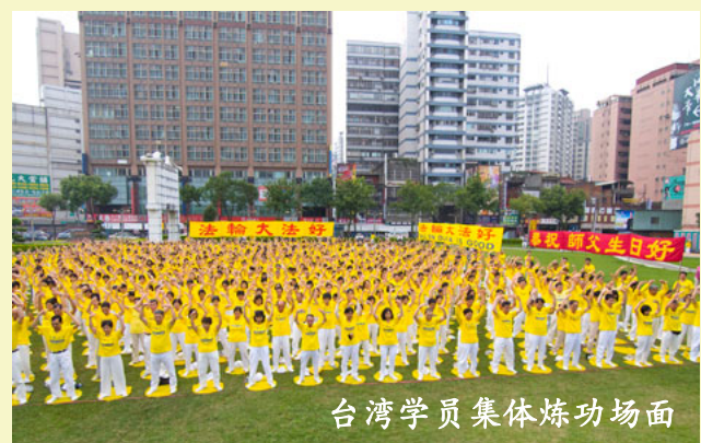
台湾学员集体炼功场面

每年的5月13日，是“世界法轮大法日”，各国的法轮功学员会在这一天举行活动来表达对法轮大法的感恩，呼吁抵制中共的迫害。台湾法轮功学员洪大的排字炼功场面，蔚为壮观。