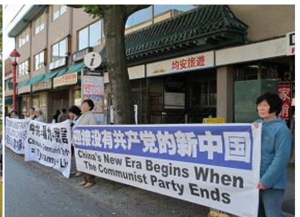
声援中国民众退出中共相关组织的横幅