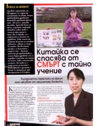
图：《女士周末》发表专访法轮功学员的文章

党员的人数。法轮功没有人员名单，所以很难统计世界上共有多少人修炼。“法轮功既不是宗教，也不是政治。”刘