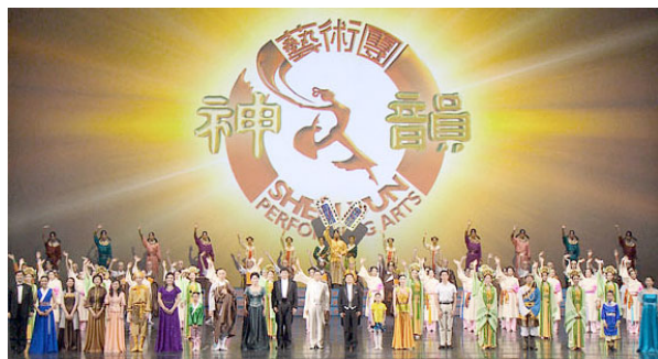
图: 神韵艺术团 (资料)