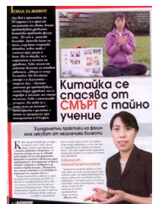
图：《女士周末》发表专访法轮功学员的文章

党员的人数。法轮功没有人员名单，所以很难统计世界上共有多少人修炼。“法轮功既不是宗教，也不是政治。”刘