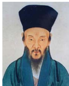
图：明朝思想家、教育家王阳明

不久，王华果然状元及第，后官至吏部尚书，娶妻郑氏，夫唱妇随。王阳明出生时，他的祖母曾梦见屋上仙乐齐鸣，旗幡招展，一群仙人驾着祥云送一小孩儿来家，并听到一天神高叫：“贵人来也”，随后仙人们驾起彩云而去。他的祖母忽然惊醒并听到了啼哭声，这时侍女报郑夫人已产