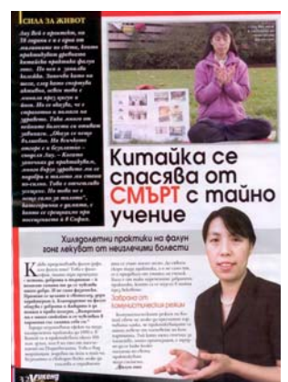
图：《女士周末》发表专访法轮功学员的文章

党员的人数。法轮功没有人员名单，所以很难统计世界上共有多少人修炼。“法轮功既不是宗教，也不是政治。”刘