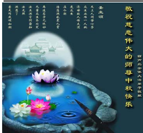
图：大陆法轮功学员 2010 年中秋节以贺卡表达对李洪志师父的问候和感恩