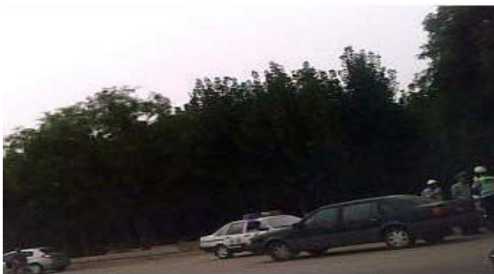
开庭这天, 通往莱阳法院的四个路口均在一公里外有警察设卡戒严

十九日上午, 不少市民传言说莱阳又出大事了: 莱阳市从安居小区西路口一直到古柳镇南的转盘路口长达数公里的公路被交警封锁, 大车、公交车都必须绕道行驶, 仅允许小车通过。市区主要街道路口也有不少警察在盘查、巡逻。法院门口更是人头攒动, 有上百号便衣、不少警察。法院路口被禁止任何车辆通过。据说法院四周围也有不少可疑车辆和便衣, 数量相当多。法院大院内也有大批警察队伍聚集。