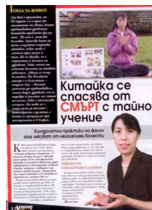
图：《女士周末》发表专访法轮功学员的文章

党员的人数。法轮功没有人员名单，所以很难统计世界上共有多少人修炼。“法轮功既不是宗教，也不是政治。”刘