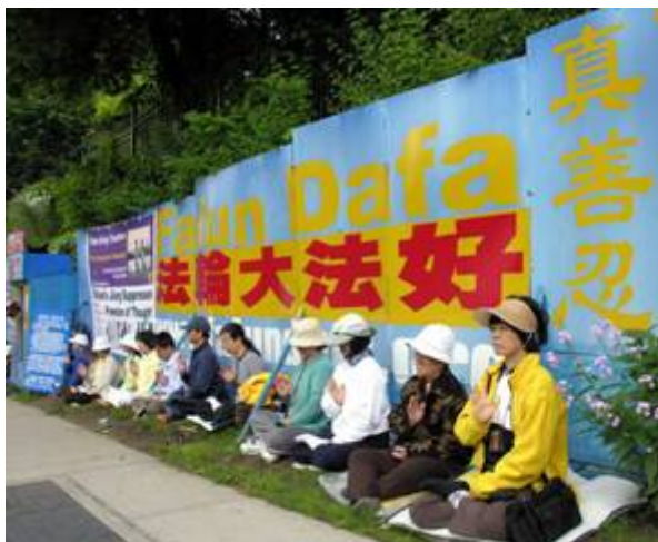
■ 温哥华法轮功学员在中领馆前抗议中共迫害已持续九年

中共对法轮功的残酷迫害已经持续十多年了，而且还在进行中。但是无论在中国，还是在世界上，了解法轮功的人们都由衷地对法轮功修炼者的行为表示认同。这说明什么？美好是不分国界的，“真善忍”经过法轮功修炼者的努力，已经成为普世的价值而呈现在世界人民的面前。世人对“真善忍”的认同就是对迫害的否定，就是对法轮大法的赞颂！（文/云外）◇