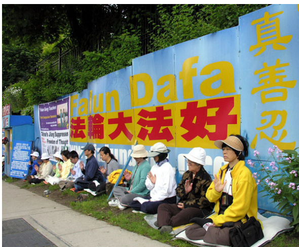
■ 温哥华法轮功学员在中领馆前抗议中共迫害已持续九年

中共对法轮功的残酷迫害已经持续十多年了，而且还在进行中。但是无论在中国，还是在世界上，了解法轮功的人们都由衷地对法轮功修炼者的行为表示认同。这说明什么？美好是不分国界的，“真善忍”经过法轮功修炼者的努力，已经成为普世的价值而呈现在世界人民的面前。世人对“真善忍”的认同就是对迫害的否定，就是对法轮大法的赞颂！（文/云外）◇