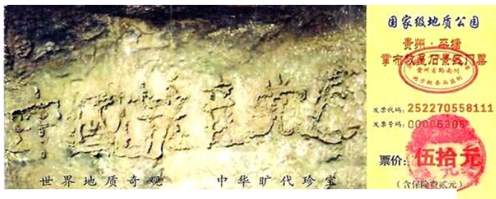
上图贵州省平塘县掌布乡风景区门票

◆2002年6月，贵州省平塘县掌布风景区发现一块巨石，石面上有排列整齐的六个大字：“中国共产党亡”。经三路专家前往考察，这块巨石距今已有2亿7千万年，500年前从高崖上落下来，断成两块，字在右边那块巨石上，清晰可辨。经鉴定，这些字都是天然形成的，没有任何人为加工的痕迹。当时国内一百多家媒体包括新华社、中央台都有过报道与专题，网上也能搜索到相关照片，当然，它们都不敢提最后那个字，但从照片上可以看出来。亿年巨石崩裂，突现标语“中国共产党亡”，这是偶然的吗？这是天意：天真要灭中共了。请民众顺应天意，三退自救。◇