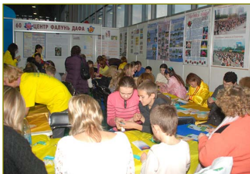
左图：奖状 右图：越来越多的人聚集在法轮功展位

法轮功学员的展台上，摆放了很多彩色图片，记录了法轮大法在全世界一百多个国家传播，有上亿人修炼的情况。当地法轮功团体每年两次参加该展会，举办方表示，几年来看到法轮功的展位真是没有任何宗教、政治和商业的目的，确实是非常纯正高尚的功法，对儿童和家长都非常有益，令人感动。