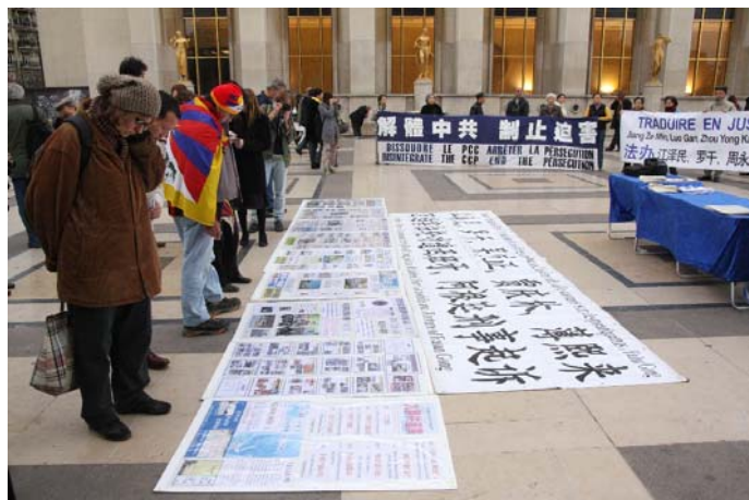
图：路人驻足观看中共迫害法轮功的真相资料

布鲁雷先生认为，法轮功是一种有利于健康的打坐方式，以和平的方式存在，并没有威胁社会的稳定，相