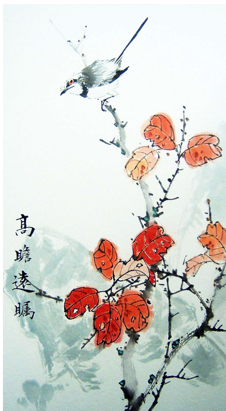
明慧网绘画作品选登