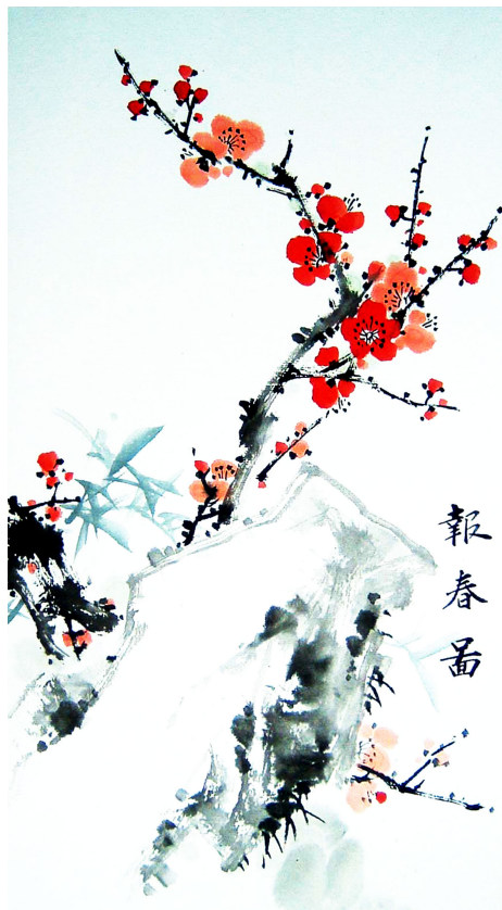
明慧網繪畫作品選登

拖車司機要送我上醫院，我不讓。我是修法輪大法的，老師叫做好人，遇事不給別人找麻煩。回家後，發現兩個鋼質防盜門被砸出一個人形來，而我平安無事。我知道這是我修大法，師父救了我的命，我發自內心地謝謝師父！