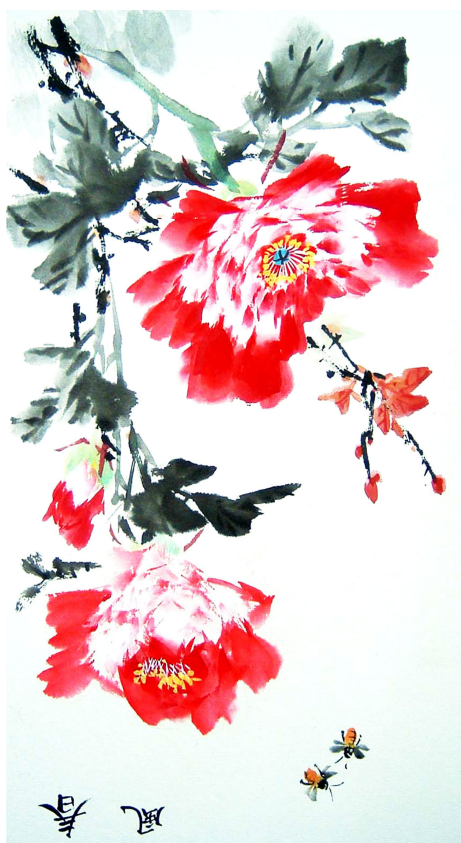
明慧网绘画作品选登

我是安徽省亳州譙城区的一个行政干部，以前受无神论毒害很深。一个炼法轮功的邻居多次跟我说：“法轮大法是正法，是佛法，在危难来临时，诚念‘法轮大法好，真善忍好’能逢凶化吉，救人性命。”我根本不相信——看不见、摸不着，念句话就能好？ 天有不测风云。去年初春，我儿子发生重大车祸，脊椎骨断了两节，送医院抢救。医生说，治愈的可能性非常小，就是能治好，下肢可能会瘫痪。儿子是我的独子，才20岁啊，我当时心疼得都不想活了。 邻居听说我儿子遭此大难，很是同情，又告诉我，诚念“法轮大法好，真善忍好”，就会有奇迹出现。 为了儿子能好，我答应了，帮儿子做了三退，并让他诚心念“法轮大法好，真善忍好”，自己也帮他念。儿子的痛苦逐渐减轻，身体迅速好转。一星期后，下肢能动弹了；两个月后，出院回家了；年底完全康复。 这件事彻底扭转了我的偏见，我真心地谢谢法轮功师父。同时也想告诉世人：法轮功真是救人的呀！咱可不能听信诬陷法轮功的谎言，错过得救的机会啊！