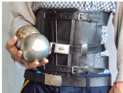
■ 手持铁球、身穿钢背心

正当我生不如死时，1996 年 5 月，我有幸开始炼法轮大法。短短八天炼功，奇迹出现了：我的手不麻了，放下了铁球；左臂也伸起来了，并脱下穿了十几年的钢背心！至今，我再没吃过一粒药，没打过一次针，铁球和钢背心也成了永生的记忆。