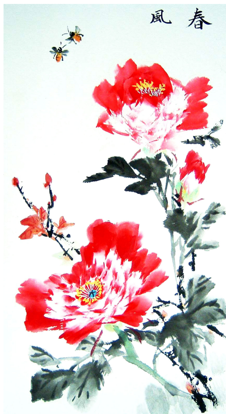
明慧网绘画作品选登

这件事彻底扭转了我的偏见，我真心地谢谢法轮功师父。同时也想告诉世人：法轮功真是救人的呀！咱可不能听信诬陷法轮功的谎言，错过得救的机会啊！