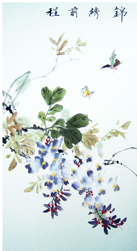
明慧网绘画作品选登

因相信“法轮大法好”而在危难之中保得性命的事例数不胜数，您可以通过突破网络封锁的软件登陆明慧网 http://minghui.org 看到更多真实事例。