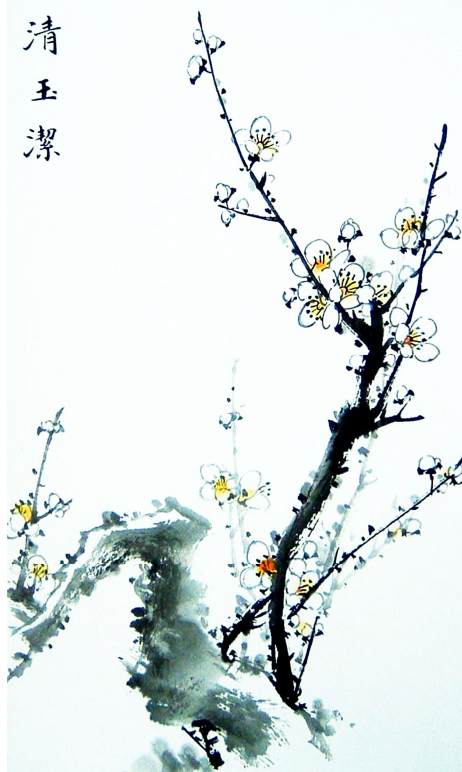
明慧网绘画作品选登