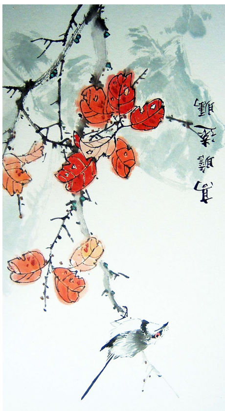
明慧网绘画作品选登

人类的灵魂有着巨大的作用。 李洪志先生，并赞扬“真、善、忍”对净化 会将“杰出精神领袖奖”授予法轮功创始人 313 件；2009 年 9 月 26 日，亚太人权基金 至今已经获得各界褒奖 1632 项，支持议案 国各地政府纷纷颁发褒奖、通过支持议案。 功讲法，开始了法轮大法在海外的传播。各 1995 年 3 月，李洪志先生应邀到法国传 论，并向中央政治局递交了报告。 了“法轮功于国于民有百利而无一害”的结 首的老干部对法轮功做了深入调查后，得出 学炼者性格也变得开朗乐观。同年以乔石为 查表明：法轮功祛病健身有效率高于 98%， 家，对 3 万多名法轮功学员做的五次医学调 1998 年，国家体育总局组织医学界专 传的盛况，做了公正客观的正面报导。 晚报》等，对法轮功的神奇功效及在国内弘 国内一些新闻媒体如《医药保健报》、《羊城 获“受群众欢迎气功师”称号；1997 年前后， 功最高奖“边缘科学进步奖”，李洪志先生 1993 年北京东方健康博览会授予法轮 地。亿万修炼者身心健康，道德升华。 1992 年~1999 年，法轮功传遍神州大