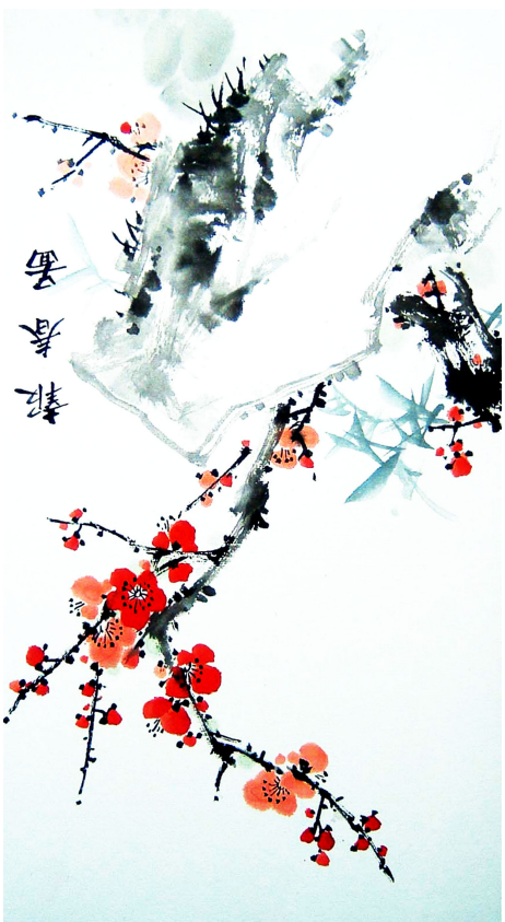
明慧網繪畫作品選登