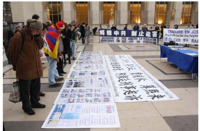
图：路人驻足观看中共迫害法轮功的真相资料

布鲁雷先生认为，法轮功是一种有利于健康的打坐方式，以和平的方式存在，并没有威胁社会的稳定，相