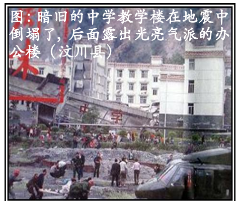
图：暗旧的中学教学楼在地震中倒塌了，后面露出光亮气派的办公楼（汶川县）

愿国人都能穿越暴力和谎言，快快的明白真相，获得属于自己的东西，过上真正幸福的日子。◇