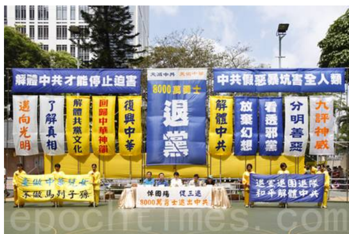
图：10月1日香港声援国内八千万勇士退出中共

◆ 2009年初，美国总统奥巴马就职演说，再次正式把共产主义和恐怖主义相提并论，视为打击对象。