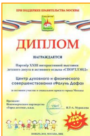
法轮功团体在莫斯科儿童健康博览会获奖

【明慧网】二零一零年十一月三日到七日，莫斯科市政府举办的第二十三届“儿童健康博览会”在莫斯科的全俄展览中心举行，当地法轮功学员也参加了本次博览会。法轮功的展台上摆放了很多彩色图片，记录了法轮大法在全世界一百多个国家传播，有上亿的学员在修炼的情况。当地法轮功团体每年两次参加该展会，举办方表示，几年来看到有的参展者就是为了卖东西，有的展品对儿童来说甚至有不好的因素，而看到法轮功的展位真是没有任何宗教、政治和商业的目的，确实是非常纯正高尚的功法，对儿童和家长都非常有益，非常感动，所以特别在价格等方面给予很大的优惠。