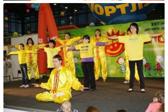
上图：越来越多的人聚集在法轮功展位 下图：学员们每天都在主展台展示功法