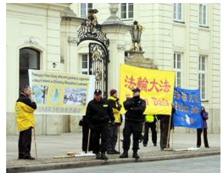
部份法轮功学员在中国大使馆、华沙总统府前抗议中共迫害