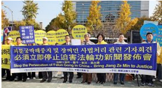
法轮功学员中使馆前谴责中共迫害

【明慧网】二十国集团(G20)首尔峰会于韩国当地时间二零一零年十一月十一日召开，韩国法轮大法学会于当日上午在中共驻韩使馆前举行集会，谴责中共对法轮功的残酷迫害，并呼吁法办迫害元凶江泽民。