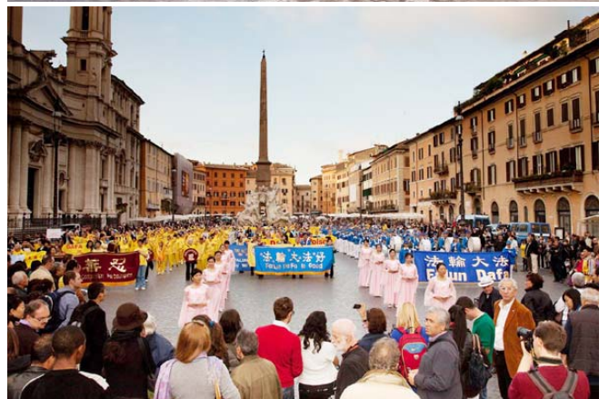
上：欧洲天国乐团经过维克多伊曼纽尔二世纪纪念碑 下：法轮功游行队伍在四河喷泉广场受关注