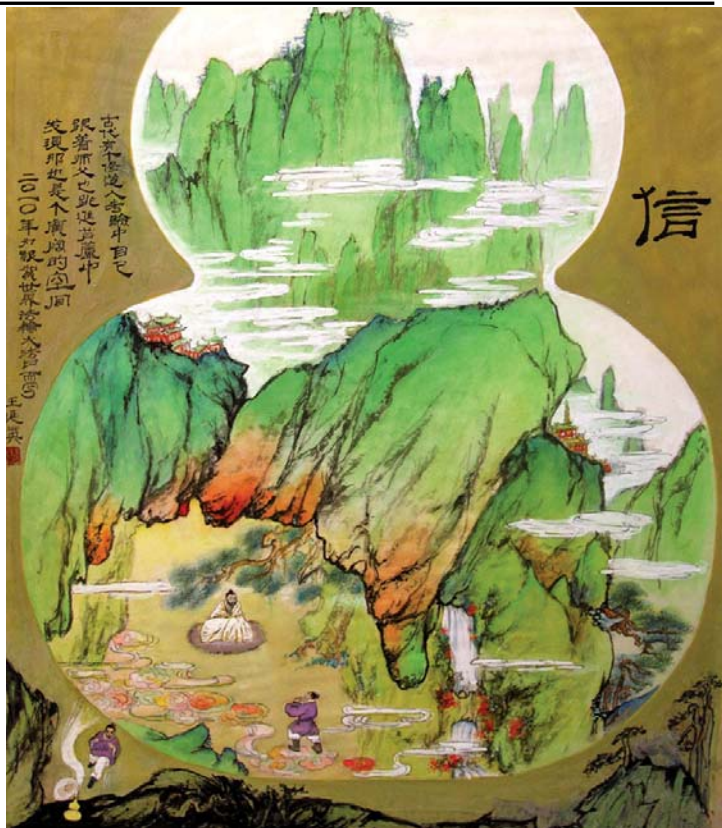
水墨画《葫芦里的世界》赏析：古代有个修道人跟着师父跳进葫芦中，发现那也是一个广阔的世界。

从此，我主动了解法轮功。就在我看《转法轮》书的时候，发生在我自己身上的一件事彻底改变了我对法轮功的看法。有一天，我用高压锅熬汤，熬着熬着，高压锅鸣叫了，我就去调节煤气灶，刚用手去扭开关时，突然“砰”的一声巨响，高压锅爆炸了，我只感到脸上