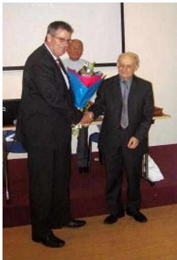
■ 昆士兰联邦参议员费那献花给加拿大国际人权律师大卫·麦塔斯先生

作为人权方面的权威律师, 麦塔斯的演讲令在场观众深深折服, 而他不畏艰辛和自身安危, 揭露中共暴行的义举更是令人们感动。昆士兰联邦参议员费那表示, 从今以后要更加关注法轮功问题。◇