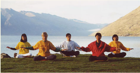
图：新西兰学员晨炼 →

法轮大法已传遍世界六大洲的 100 多个国家和地区，受到 100 多个国家和地区的人民的喜爱和支持；法轮大法的主要著作也被翻译成三十多种语言，在世界各国、各民族中广泛传播。