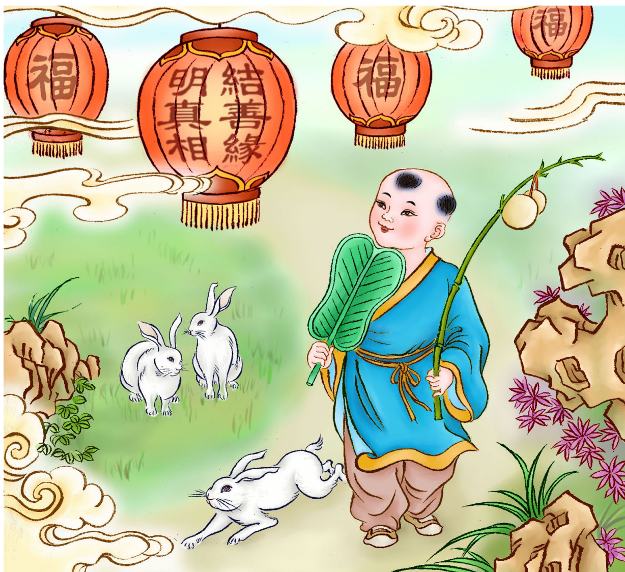
· 法轮功学员绘画作品 ·