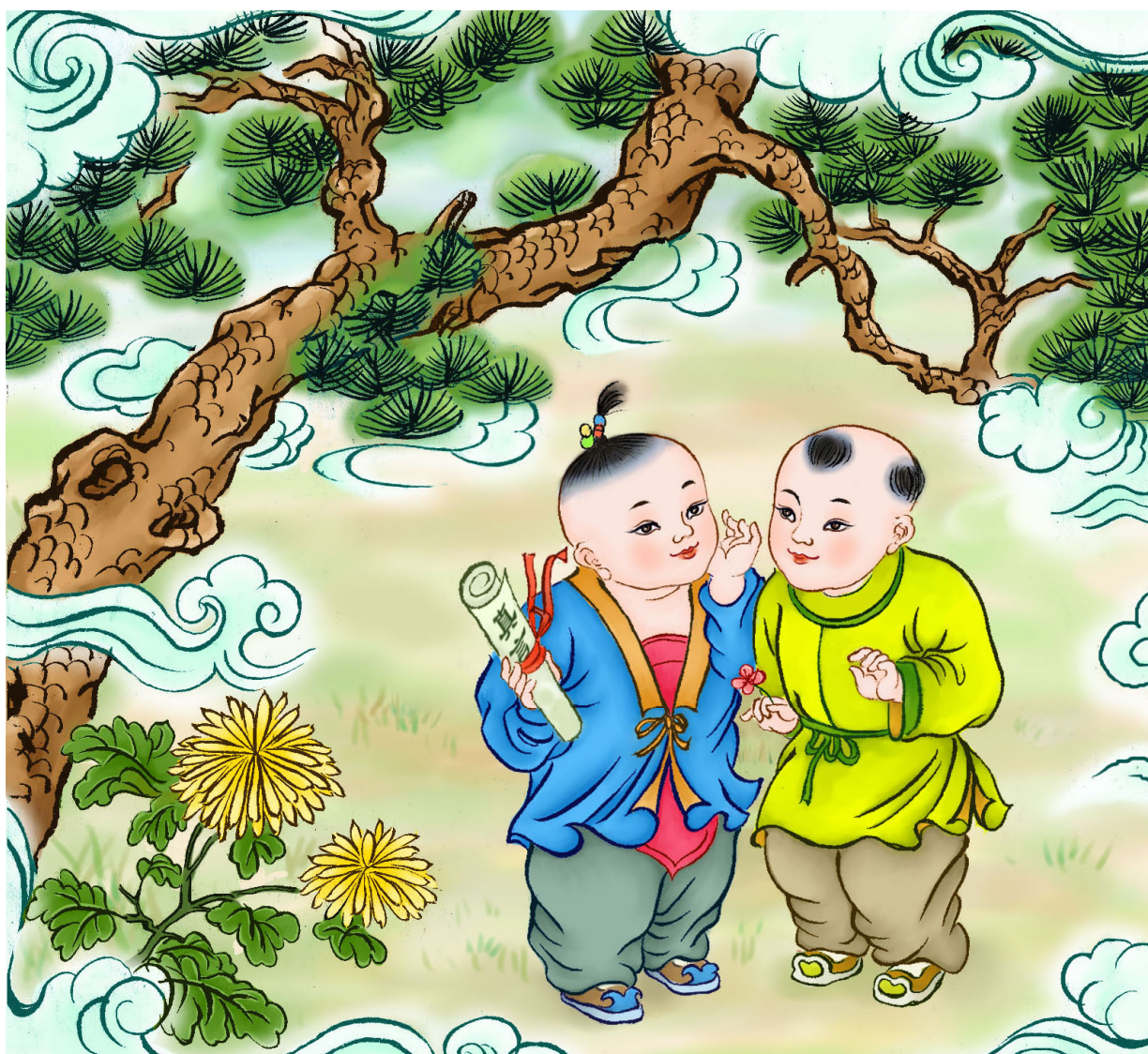
· 法轮功学员绘画作品 ·