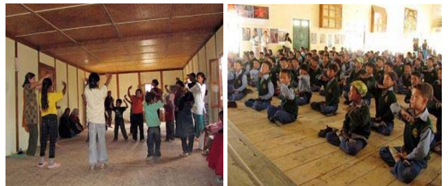
■ 二零一零年的夏季和秋季，法轮功学员在印度举办的各类弘法活动。

万户、图书馆、学校教导员和校长、警察局、部队驻扎营、法官、律师、医院、宗教领袖、西藏市场、餐馆、网吧、旅行社、酒店，等等等等。