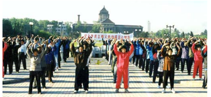
图：1998 年长春法轮功学员集体炼功