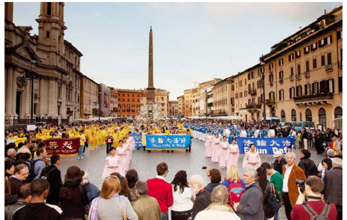
上：欧洲天国乐团经过维克多伊曼纽尔二世纪念碑下：法轮功游行队伍在四河喷泉广场受关注