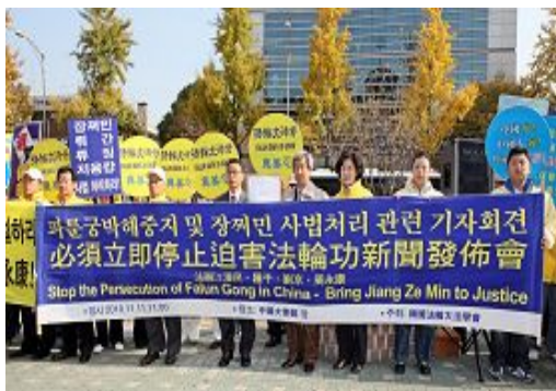
韩国法轮功学员在使馆前谴责中共迫害元凶江泽民。

【明慧网】二十国集团(G20)首尔峰会于韩国当地时间二零一零年十一月十一日召开，韩国法轮大法学会于当日上午在中共驻韩使馆前举行集会，谴责中共对法轮功的残酷迫害，并呼吁法迫害元凶江泽民。