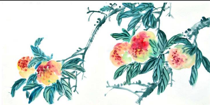
图：水墨画“寿桃”，作者：大陆大法弟子

由于我手中有一定的权力，又是领导干部，因此每到逢年过节下属单位和身边的同事就会给我送一些礼金、礼品之类的。修炼法轮功之前，我都是笑纳的，甚至每到年关跟前真的是惦记的：“这个单位怎么还不来啊？”随着修炼层次的提高，我渐渐认识到不应该那样做了，我就对他们说：“我修炼法轮功了，这些钱我不能要。”实在是非得给的，我就当作奖金发给下属员工。至于身边同事的