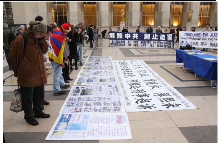
图：路人驻足观看中共迫害法轮功的真相资料

布鲁雷先生认为，法轮功是一种有利于健康的打坐方式，以和平的方式存在，并没有威胁社会的稳定，相