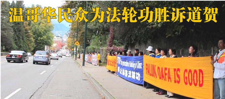
图：温哥华法轮功学员在中领馆前打出中英文“法轮大法好”等横幅

(明慧记者王枚温哥华报导)二零一零年十月二十三日,加拿大温哥华法轮功学员迎来了在中领馆前抗议案胜诉后的首个周末。中午起,许多学员来到中领馆前,拉起了近百米长的“法轮大法好”、“世界需要真善忍”、“停止迫害法轮功”等横幅。