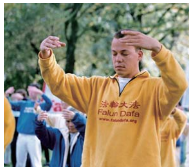
图：法轮大法使亿万人身心健康，已弘传世界一百多个国家，吸引了各族裔的人修炼。

九八年，为了配合国家体育总局对法轮功的正面调查，广东省法轮功辅导总站邀请一批专家学者，对一万多名广东各地法轮功学员进行了抽样调查，结果发现，法轮功祛病健身有效率为 97%，并有许多现代医学无法治疗的顽症患者，在修炼法轮功后彻底康复；专家们认为：法轮功带给人的身心受益、道德回升，已经在社会