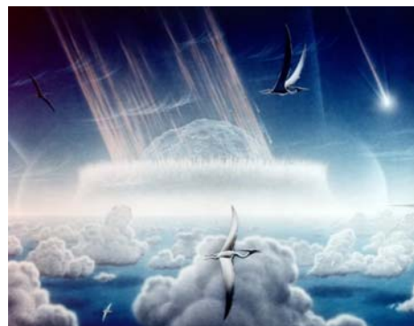
图：一个直径二十五公里（如同中等城市大小）的小行星，以每秒三十公里的速度撞向地球，造成了史前文明的毁灭和地球上的一次史前物种大灭绝。

一个平静的早晨，人们刚刚从沉睡中苏醒，天空中翼龙展开近十米的翅膀带着刺耳的鸣叫扑向它的猎物。热带阔叶林中一支剑龙带着它的幼子在水边安静地喝着水，不远处一只霸王龙贪婪地盯着剑龙母子。忽然远处天空传来一种巨大、特别的声音，林中所有恐龙都竖起了耳朵朝向声音传来的方向，人们惊愕地抬头望向天边：一个直径二十五公里（如同中等城市大小）的小行星，以每秒三十公里的速度撞向地球，造成了史前文明的毁灭和地球上的一次史前物种大灭绝。