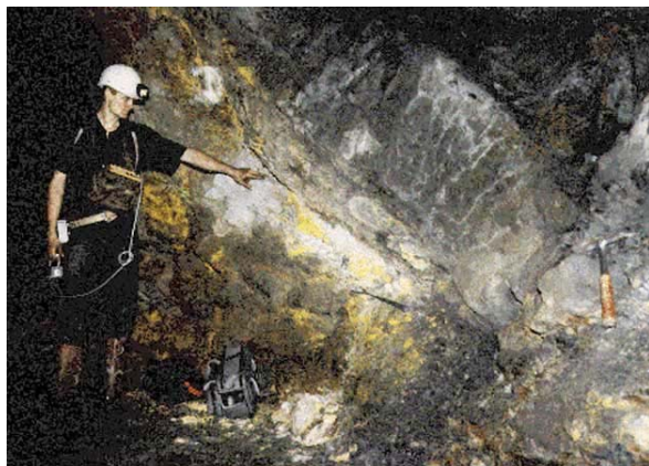
图：美国航天局 2005 年 2 月 20 日公布了在加蓬共和国发现的 20 亿年前运转的核反应堆图片。