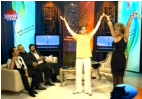
图：节目主持人（右）在向法轮功学员现场学功

土耳其最大电视台 SHOW TV 自 2010 年 10 月 14 日起，多次邀请法轮功学员在其晚间黄金时段播出的节目中介绍法轮功，向观众现场演示法轮功功法。节目赢得了广大电视观众的喜爱和好评。