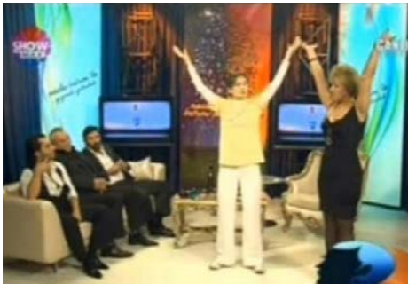
图：节目主持人（右）在向法轮功学员现场学功

土耳其最大电视台 SHOW TV 自 2010 年 10 月 14 日起，多次邀请法轮功学员在其晚间黄金时段播出的节目中介绍法轮功，向观众现场演示法轮功功法。节目赢得了广大电视观众的喜爱和好评。