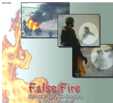
图：揭露天安门自焚骗局的国际获奖纪录片《伪火》也在大陆媒体上被插播

法轮功自 1992 年公开传出以来，由于“真善忍”的巨大感召力和祛病健身的奇特效果，修炼人在短时间内剧增，