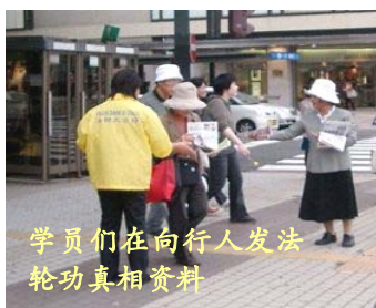
学员们在向行人发法轮功真相资料