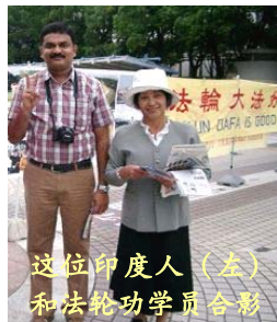
这位印度人（左）和法轮功学员合影

【明慧网二零一零年十月二十六日】二零一零年十月二十三日和二十四日周末这两天，日本法轮功学员继续在爱知县名古屋市最繁华的商业区，向人们揭露中共对法轮功学员的残酷迫害，发送真相资料，使很多有缘人了解了真相。