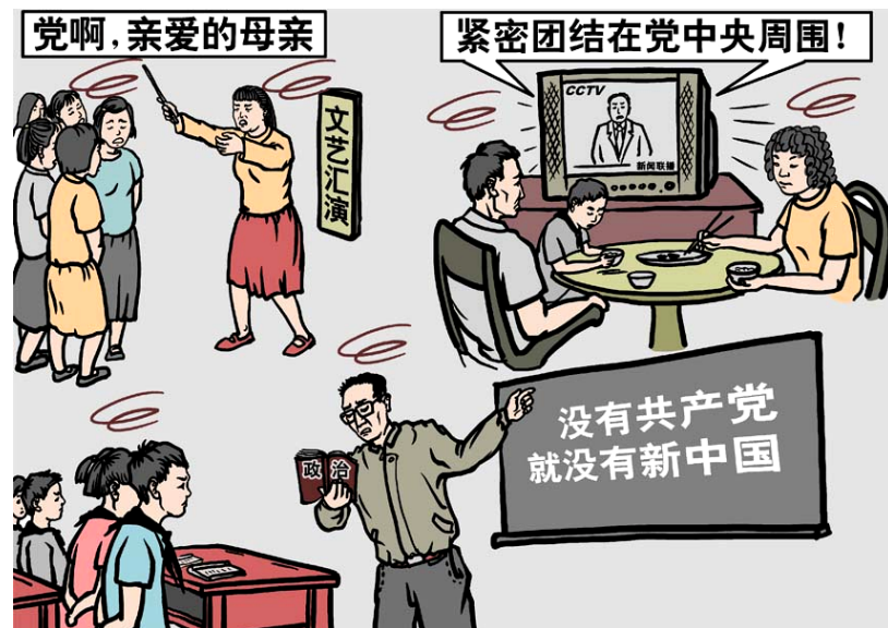
漫画：无处不在的洗脑

希望大陆的同胞都早日明真相，不要让自己及自己的孩子继续受毒害，一代代沦为被邪党洗脑的奴隶，让孩子们拥有一个真正健康、快乐的成长环境。◇（文 / 清宁）