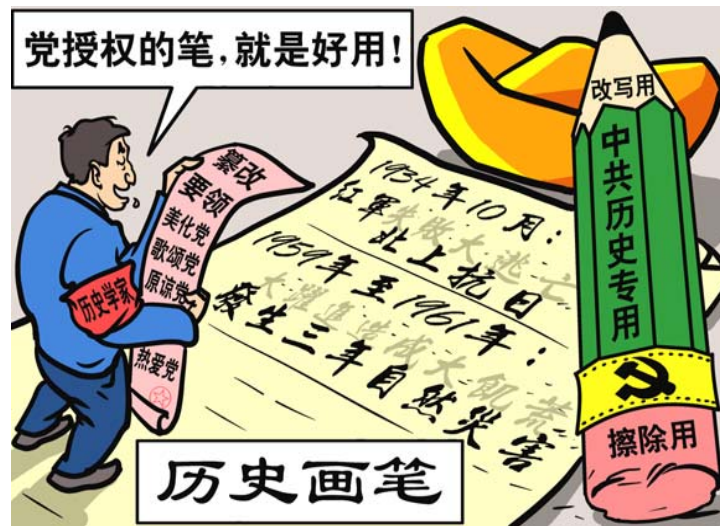
中共的历史就是造假的历史

千万人饥饿而死……我开始知道，中国共产党党史，甚至近百年的中国历史，都是按照共产党的需要，进行了歪曲和编造。”（文据曾慧燕：《杨继绳为3600万饿殍立墓碑》）◇