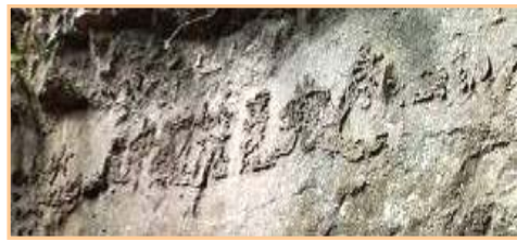
■ 贵州平塘县掌布乡“藏字石” 惊现“中国共产党亡”。

神的意愿总会在人世间显现。二零零二年，贵州平塘县掌布乡斗坪村一名叫王国富的村书记发现了一块大石头，石头上惊现“中国共产党亡”六个大字。此事一出，CCTV专门前去采访，中科院曾两次派人去鉴定此石究竟是人造还是天然的。最后发现此石是二亿七千万年前形成的，在石头的断面出现的这六个大字未曾发现人工雕琢的痕迹。时至今日，已有无数的游客参