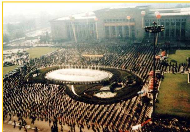
历史图片 一九九八年十月一日九千多名法轮 大法修炼者在河北省博物馆广场举行集 体大炼功的壮观场面。

认清共产党的骗局，就会抛弃对共产党的任何幻想，快快退出中共的党、团、队，准备迎接没有共产党的新中国吧。这是你正确的选择，未来的美好等待你！